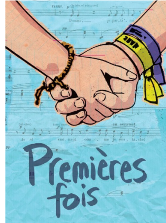
Premières Fois - Roman et guide pédagogique, FLCPF/CEDIF, 2018.